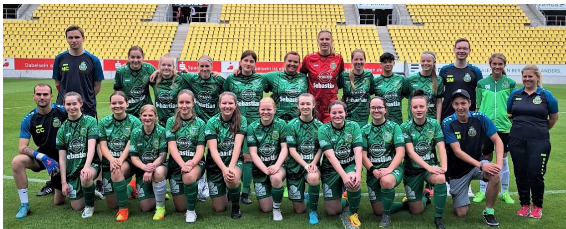
Les dames de La Calamine en visite chez Alemannia Aachen