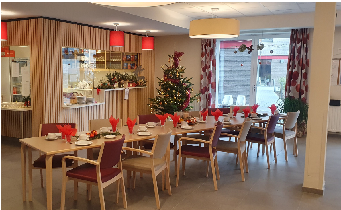
Le repas de midi aura lieu à partir d'octobre les mardis et/ou jeudis à partir de 11h30 à la cafétéria de la résidence Leoni.