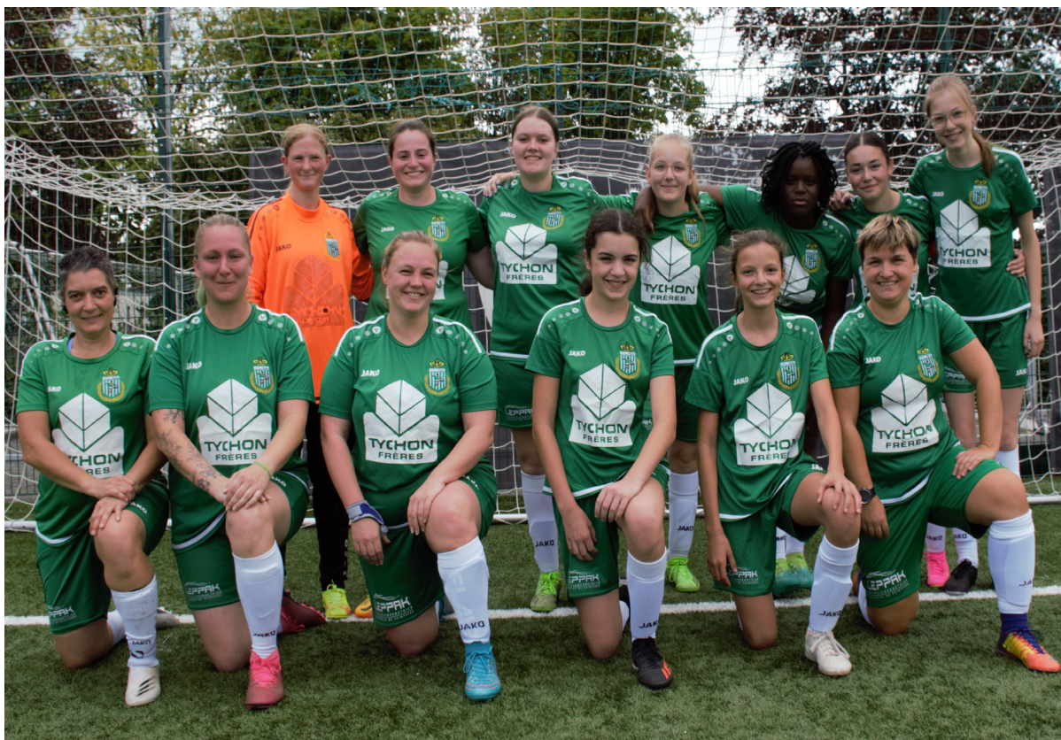
La deuxième équipe féminine du RFCU lors de son match à l'AS Eupen le 27 août.