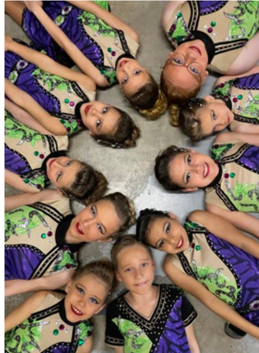
Garde Polka juniors, 2e division, crocodiles