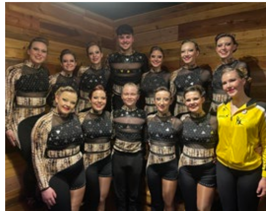
Danse show moderne, classe principale, Tornado 3