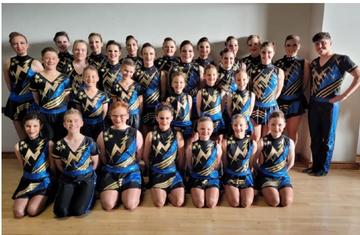
Les jeunes et la classe principale 2022-2023