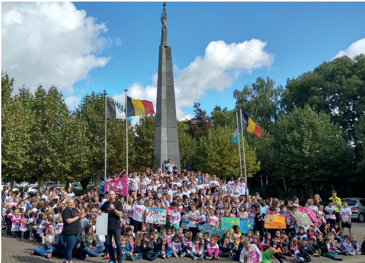
L'école primaire de l'Athénée César Franck a participé à la course caritative ELA en 2019.