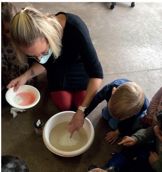
Les enfants de l'ACF sont devenus de petits professionnels de l'hygiène.

Vous trouverez des informations actuelles et des photos des manifestations passées sur le site web de l'école ( https://www.grundschule.cfa-kelmis.be/ ) ainsi que sur Facebook (Conseil des parents cfa) et Instagram (elternratcfa).