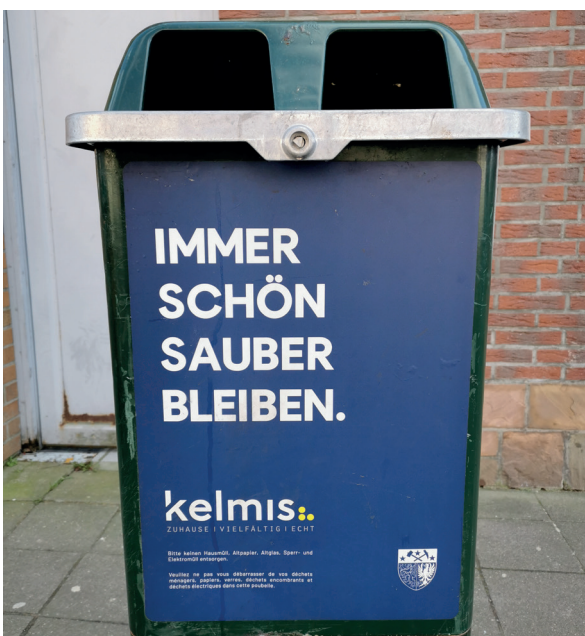
Les déchets ménagers ne peuvent pas être déposés dans les poubelles publiques.