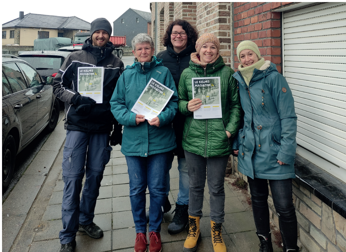
Le Conseil des parents distribue deux fois par an le « Kelmis magazine » .