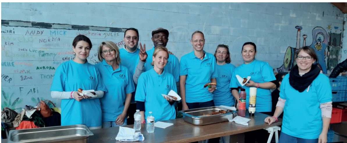
Le Conseil des parents s'est réorganisé en ASBL.