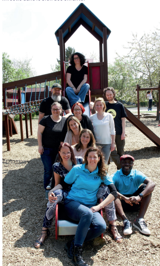
Le Conseil des parents est actif tout au long de l'année et met sur pied toute une série d'événements.