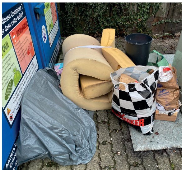
Le matelas en mousse jeté à côté des conteneurs à verre et à vêtements: les responsables ont été démasqués.

Exemple : sachets de thé, épluchures de fruits, coquilles d'œufs, épluchures de pommes de terre et de légumes, bouquets de fleurs, boîtes à pizza, litière biologique, bâtonnets de glace, papier de cuisine, restes de repas cuits, os, etc..