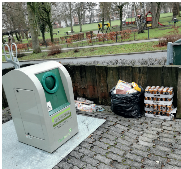
Cette image n'est malheureusement pas rare non plus.